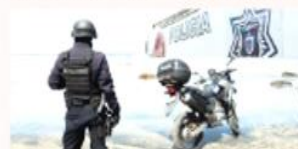
TIJUANA. La meta fue garantizar el orden, ante el incremento de turistas por la conmemoración del Labor Day.