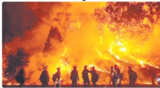
SAN DIEGO. Curca del pedregado de Alpina, al este de San Diego, y a solo unos kilómetros al norte de la frontera con México, también se descontroló un incendio, que desde el sábado corre rápidamente

SAN DIEGO. Por lo menos 27 incendios ardían este domingo en California entre temperaturas promedio superaron los 40 grados centígrados. Los dos siniestros más recientes consumían 10,000 hectáreas en Fresno y en la frontera con México cerca de Toluca. El Departamento Forestal de California reportó que un incendio que inició cerca de